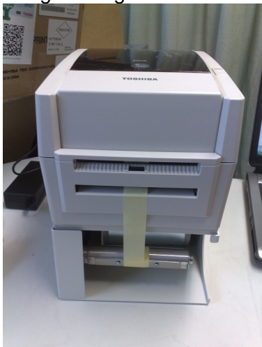
Foto 3. De voorkant

Het gele dragermateriaal wordt opgewikkeld onderop. Dat staat opgeruimd.